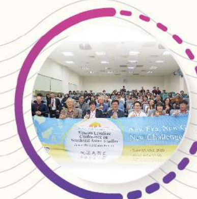
東南亞學術，研討會重鎮