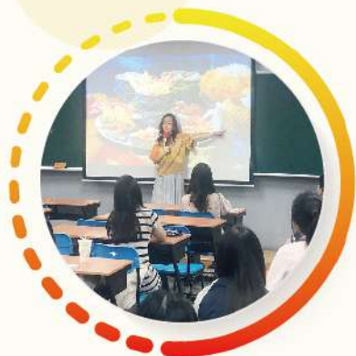
師資超專業，六成是外師