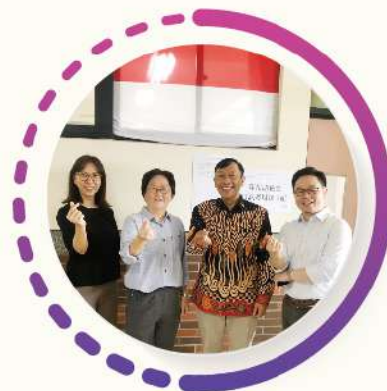
越印泰語檢，領先全國辦