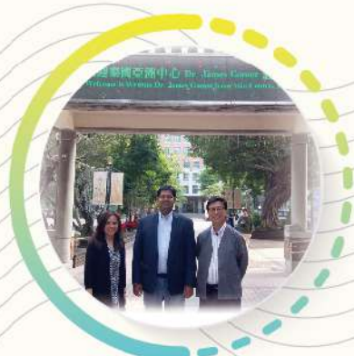
知名姊妹校，交換機會多