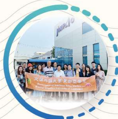
台商研習團，實習做中學