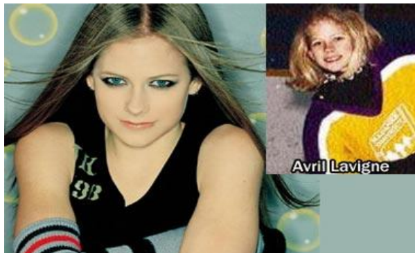
Ca sĩ Avril Lavigne